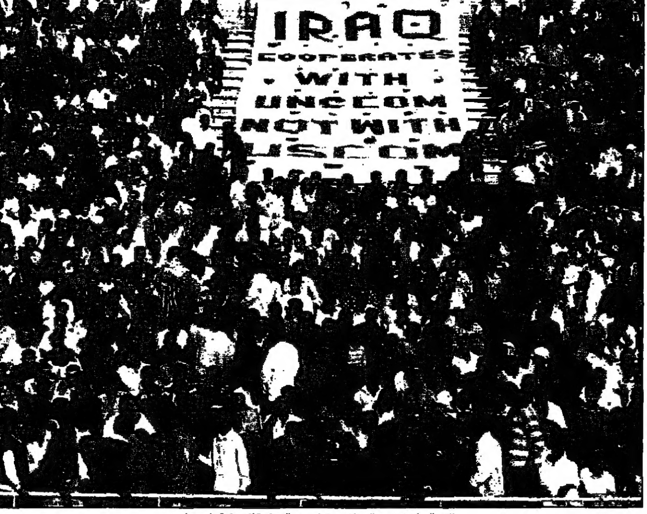
الآلاف العراقيين في حفل حاشد ببغداد تندد بالسياسة الاميركية

الكويت - روتنبرغ - تجر جدل داخل مجلس الأمة الكويتي اسم حول صفقة شراء صواريخ سكوا البريطانية وامر نائب في المجلس ان الصفقة تضمنت دفع عمولة لروسيا.